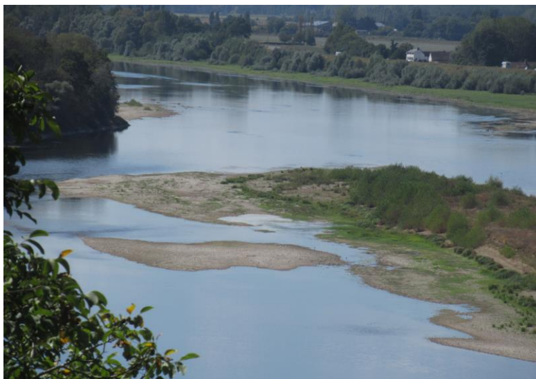
Chaumont/Loire été 2022 (pareil à Amboise et Nazelles...)